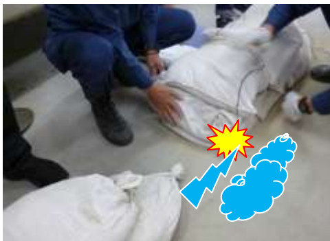
袋口は水流のない方向に置く