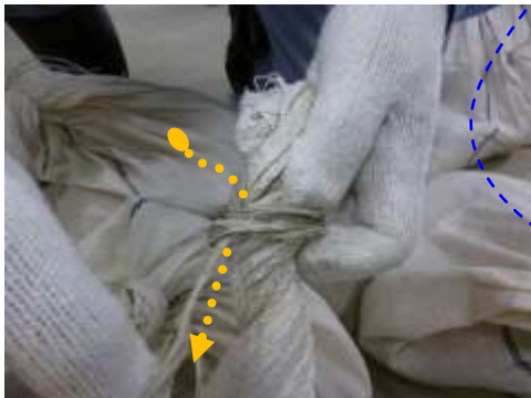
ひもの端を親指でつくった隙間を使い 上から下に通す