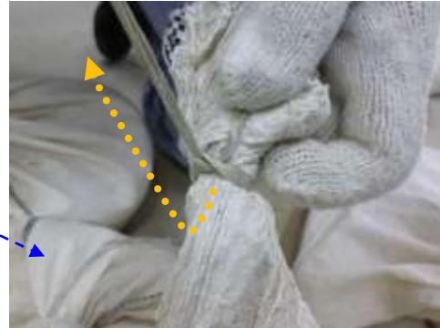
ひもの端を上引き上げ完了