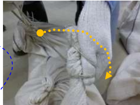
親指を添えて、ひもを2・3回(軽く)廻す