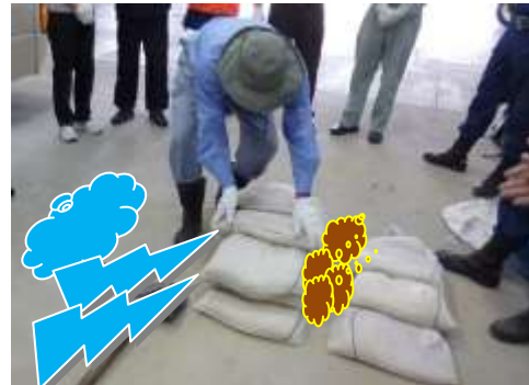
流れが強い場合は二列積で間に土・石を入れて補強する(杭が打てれば使用する)